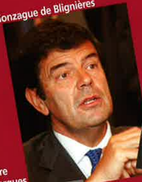
Gonzague de Blignières